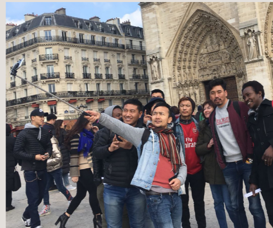
Les élèves du programme ESIRAS découvrent Notre-Dame de Paris.

Chaque jour, nos équipes bénévoles et salariées accueillent, orientent et accompagnent les personnes migrantes avec le souci constant de garantir leurs droits et la réponse à leurs besoins fondamentaux. De l'international à l'ultra-local, de la réponse à l'urgence jusqu'à l'accompagnement individualisé, la Croix-Rouge intervient à plusieurs étapes des parcours migratoires. Accueil des sortants de la zone d'attente à Roissy, mission d'administrateur ad hoc auprès des mineurs non accompagnés, centres d'hébergement d'urgence, centres d'accueil pour demandeurs d'asile, mission statutaire de rétablissement des liens familiaux, soutien psychosocial, domiciliation, apprentissage des savoirs de base... nos missions, nombreuses et complémentaires, nous permettent d'agir efficacement et de nous inscrire au plus près des besoins et attentes de chaque personne.